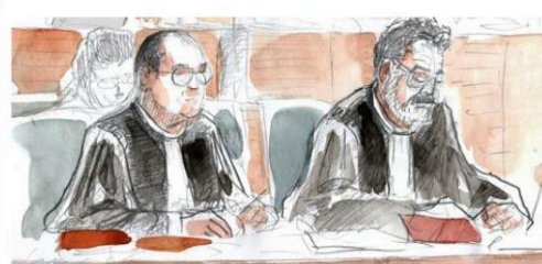
Les avocats de la partie civile.

M e Laurence Florindi-Daurat, avocate de Fabrice Excoffon : « Est-ce qu'il aurait été plus confortable que l'accusé se pendre après la commission des faits ? La